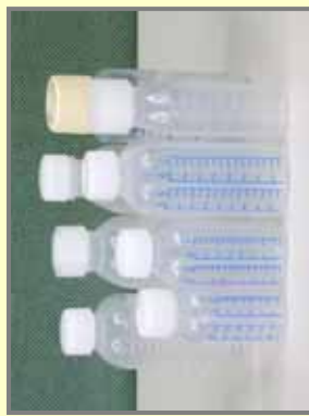
水薬容器的の例(医療用医薬品)

東京都は、子供のいる家庭の保護者に対し、子供の誤飲事故の危険性、医薬品等保管の重要性及びチャイルドレジスタントの考え方などについて普及啓発すること 国は、子供の誤飲事故情報の収集・提供等、誤飲防止対策に積極的に取り組むこと 薬剤師会は、医薬品の保管に対して、薬局窓口で消費者啓発を行うこと