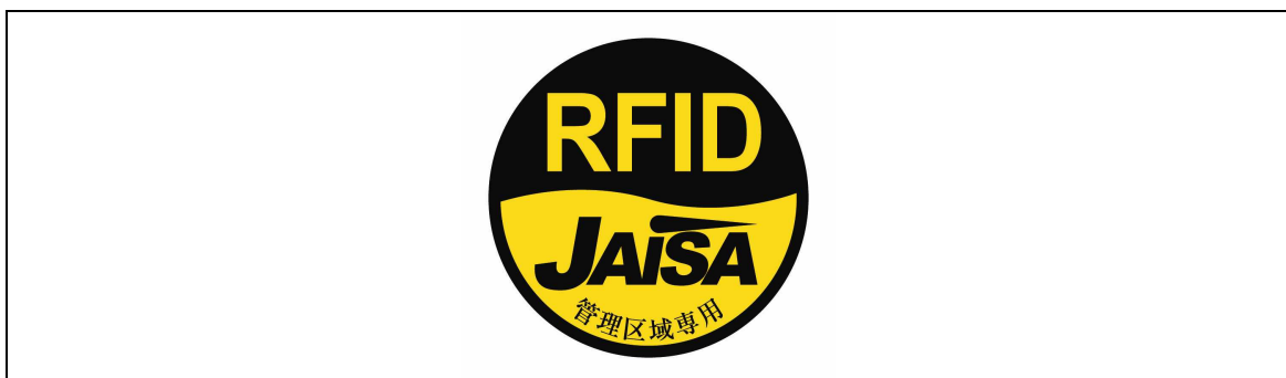
図3 管理区域専用RFID機器用ステッカ

注1： ここでは、公共施設や商業区域などの一般環境下で使用されるRFID機器を対象としており、工場内など一般人が入ることができない管理区域でのみ使用されるRFID機器（管理区域専用RFID機器）については対象外としている。なお、管理区域専用RFID機器については、（一社）日本自動認識システム協会において、一般環境への流出を防止するため、取扱説明書等に注意書きを記載するとともに、管理区域専用RFID機器用ステッカ（図3）を貼付することとされている。