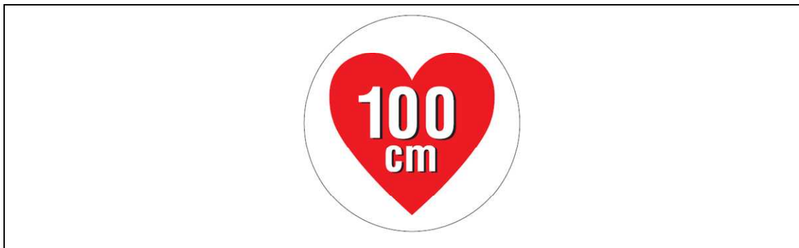
図2 据置きタイプRFID機器（高出力型950MHz帯パッシブタグシステム）用ステッカ

注1： ここでは、公共施設や商業区域などの一般環境下で使用されるRFID機器を対象としており、工場内など一般人が入ることができない管理区域でのみ使用されるRFID機器（管理区域専用RFID機器）については対象外としている。なお、管理区域専用RFID機器については、（一社）日本自動認識システム協会において、一般環境への流出を防止するため、取扱説明書等に注意書きを記載するとともに、管理区域専用RFID機器用ステッカ（図3）を貼付することとされている。