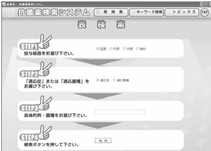
図6：表検索メインメニュー

メインメニューの「表検索」をクリックすると、図6の画面が表示されます。STEP1からSTEP3まで、該当する項目を選択して、「検索」ボタンをクリックして下さい。