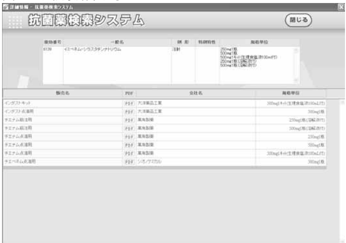
図8：表検索結果表示

上部のCSVをクリックすると、検索結果がCSV形式(カンマ区切り)の形式でダウンロードされます。成分名、適応症、適応菌種が出力されます。