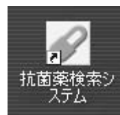
図5 メインメニュー

デスクトップ上にある右図のアイコンをクリックするとプログラムが起動します。また、「スタート」「プログラム」「抗菌薬検索システム」をクリックしてもプログラムを起動することができます。プログラムを起動すると、メインメニューが表示されます。