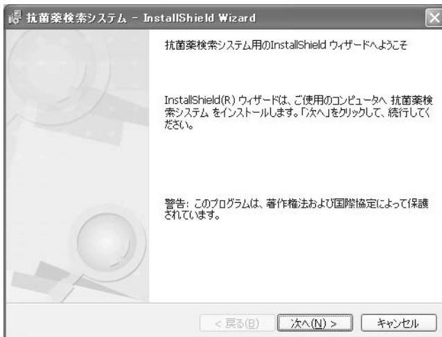
図2：インストールウィザード

[ 抗菌薬検索システムをインストール ] をクリックすると、図2のような画面が表示されますので、[ 次へ ] を2回クリックし、インストールを進めます。