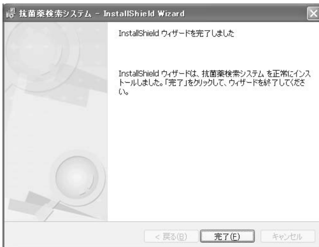
図3：インストール完了画面

正常にインストールが完了すると、図3のような画面が表示されますので、[ 完了 ] をクリックしてインストールを完了して下さい。