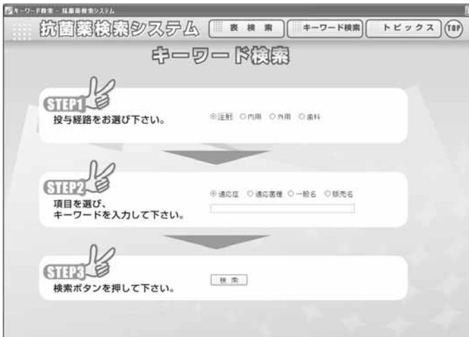
図9：表検索結果表示

メインメニューの「キーワード」をクリックすると、図9の画面が表示されます。STEP1とSTEP2まで該当する項目を選択して、「検索」ボタンをクリックして下さい。