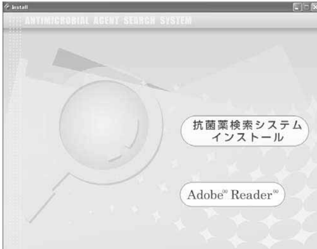
図1：インストール画面