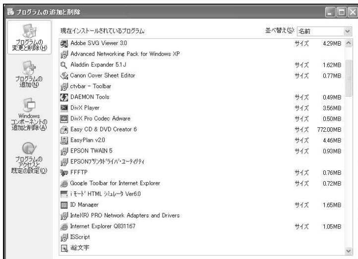
図4 「アプリケーションの追加と削除」

本ソフトをアンインストールする場合は、「スタート」「設定」「コントロールパネル」から、「アプリケーションの追加と削除」(98SE/Me)または「プログラムの追加と削除」(2000/XP)を選択して下さい。