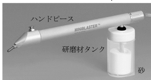
ハンドピースの各部名称