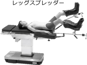
レッグスプレッター