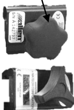
手術台用クランプ (別売品)