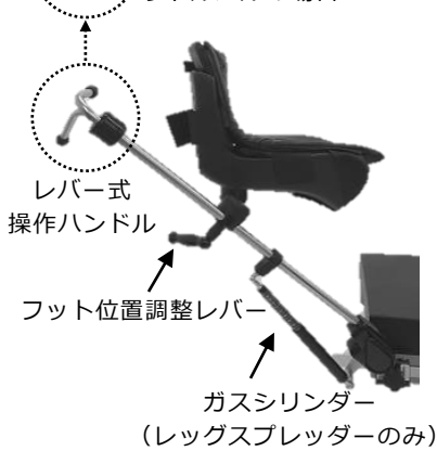
リトルパルの場合