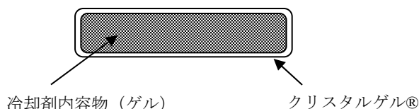
図 - 1 (断面図)