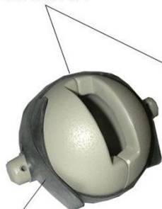
2) テスティクルシールドストラップ