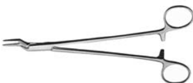
メーヨー・ヘガール型持針器 深部用