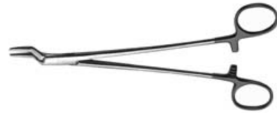
メーヨー・ヘガール型持針器 深部用 超硬チップ付

* 【禁忌・禁止】 1. 化学薬品の使用禁止 本品を化学薬品に曝すことは避けること。[腐食による損傷の原因となります] 2. 粗雑な取扱いの禁止 本品を変形あるいはキズをつける等の粗雑な取扱いはしないこと。[器具器械の寿命を著しく低下させます] 3. 磨き粉や金属ウールの使用禁止 洗浄の際、目の粗い磨き粉や、金属ウールで器具の表面を磨くことはしないこと。[本品表面に擦過傷を生じ、錆や腐食の原因となります] 4. 家庭用洗剤の使用禁止 洗浄に使用する洗剤は必ず医療用洗剤を使用し、家庭用洗剤は使用しないこと。[錆や腐食の原因となります] 5. アルカリ性・酸性洗剤・家庭用洗剤の使用禁止（メッキ品のみ） 洗浄に使用する洗剤は必ず中性洗剤（pH6～8）を使用し、アルカリ性や酸性の洗剤は使用しないこと。また、医療用洗剤を使用し、家庭用洗剤は使用しないこと。[脱色や腐食の原因となります] 6. 過酸化水素低温ガスプラズマ滅菌の禁止（メッキ品のみ） 本品に過酸化水素低温ガスプラズマ滅菌を使用しないこと。[表面が褪色し、性状に影響を及ぼします]