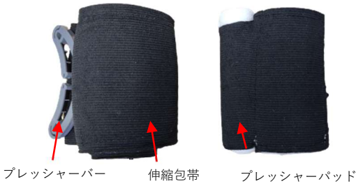
左：レスポンスフレックスバンデージ 右：ファーストエイドバンデージ