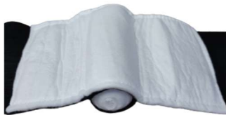
ファーストエイドバンデージは、創傷被覆材（パッド）の裏にプレッシャーパッドが入っている。