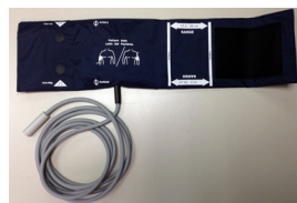
リユーザブルカフ