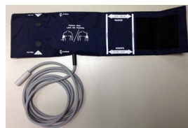
リユーザブルカフ