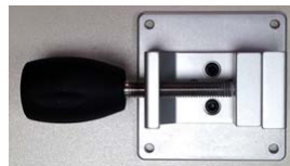
VESA 75 ユニバーサルクランプ