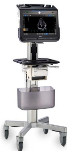
オプションカート使用時