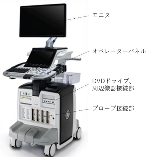
類型 LOGIQ E10s