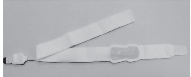
ForeSight センサ 非粘着性スモールセンサ