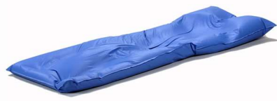
空気量調整用吸排気弁