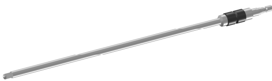
材質：ステンレス鋼 PPSU