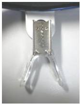
ノーズパッドが下位置