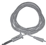
TUR 用出力ケーブル (型番: 60-0816-001)