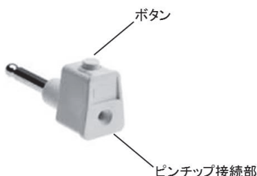
フットコントロールペンシル用アダプタ (型番: 60-0823-001)