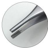
アドソンブラウン ギザ付き