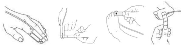
図1. 図2. 図3. 図4.