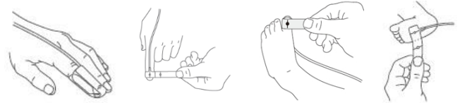
図1. 図2. 図3. 図4.