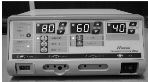
(1) 本体- (W)265 mm × (D)312 mm × (H)123 mm、重量：4.3Kg