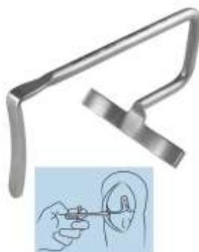
21. ホステリアー コンダイヤール オステオファイト レトラクター