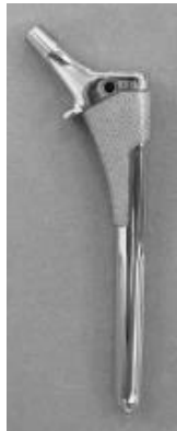
ステム(カラー付き)

2.形状・構造 本システムを構成する各製品の形状は以下のとおり。 本添付文書に該当する製品の製品名、サイズなどについては包装表示ラベルに記載されていますのでご確認ください。