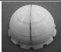
セメントカップ(ノンフランジタイプ)