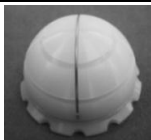
セメントカップ(ノンフランジタイプ)