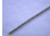
トライアルロッド