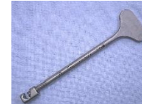
Cリングクリッパー