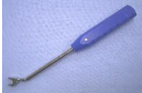
フックスターター