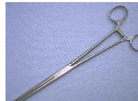
ロッドフォーセプト