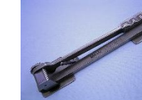
テーブルカッター