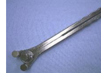
フレンチベンダー