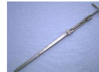
ロッドグリッパー