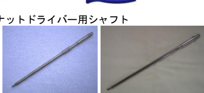
ナットドライバー用シャフト