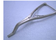
ディストラクションプライヤー