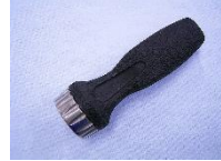
ラチェットハンドル