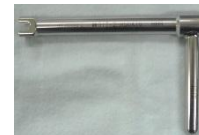
アンチローテーター