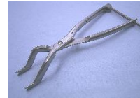
コンプレッションプライヤー