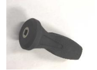
ノンラチェットハンドル