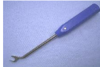
J ロッドスターター