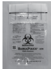
バリアパウチ (単回使用)