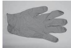
防護手袋 (単回使用)