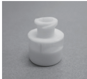
キャップ (単回使用)

本キットは、キャップ、針、シリンジ、防護手袋、アルコールワイブ(第3類医薬品)、除染剤(医療用医薬品)、バリアパウチ、ラップのいずれかの構成品を組み合わせたものである。