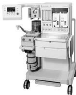
装置の外観(標準タイプ)