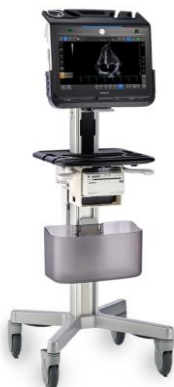
*モバイルドッキングカート(オプション)使用時