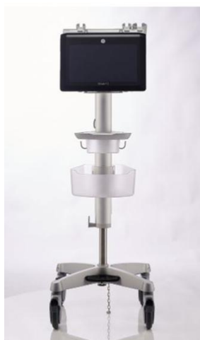
オプションカート使用時