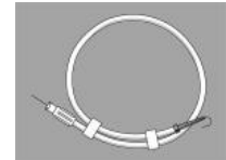
ガイドワイヤー(J型)