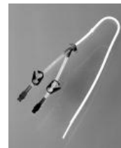
ヘモキャセシリコン ダブルルーメンカテーテル