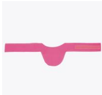
スタンダードタイプ

診断や治療のための医科/歯科処置における不必要な放射線被曝から患者、術者、又は他の人員の頸部又は甲状腺を保護する為に使用する個人用の保護装置をいう。単独で使用できる場合や、前掛や胸当てと共に使用する場合がある。本品はネックガード状で、一般的に薄い一枚の鉛又は鉛同等の材料を覆う耐液体性の外部カバーで構成されている。患者、術者又はその他人の医療従事者の頸部及び甲状腺を医科・歯科における放射線被曝から保護する。