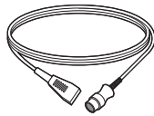
②Codman ICP ケーブル TypeV