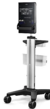
SonoSite SII スタンド