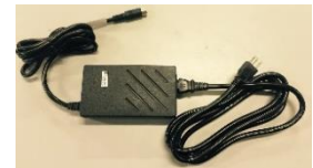
AC電源アダプタ及び電源ケーブル