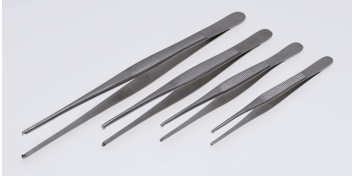
先端鉤有り、通常有鉤と名称。