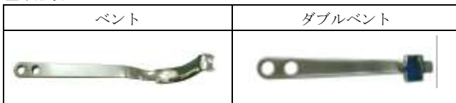
鉤部形状バリエーション