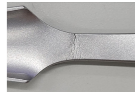
[ 図 ]