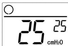
図3 液晶画面(25cmH 2 O 設定使用時)