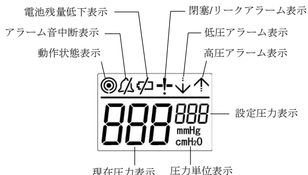
図2 液晶画面(全点灯時)