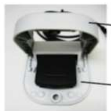
保護フラップを開いた状態