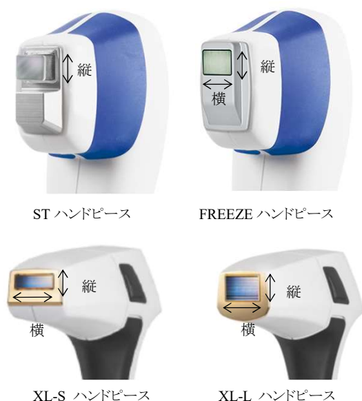
(図5) ハンドピースのレーザー出力部の縦・横の移動方向（代表例）