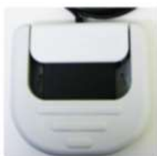
保護フラップを閉じた状態