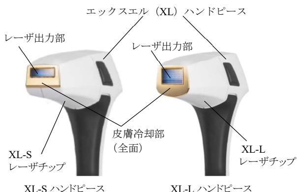
(図2) ハンドピース、レーザチップ、EasyClean カバー