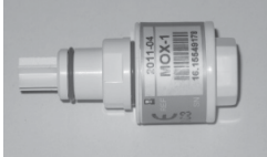
FiO 2 センサ