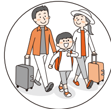
旅行など環境の変化で おなかの調子をくずしたときに