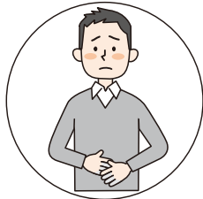
おなかの弱い方の 整腸に