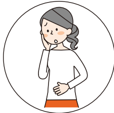
おなか はったときに