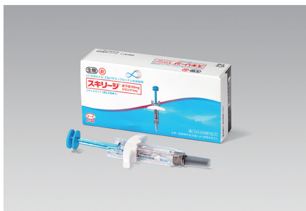
▲ スキリージ 皮下注150mg シリンジ1mL

スキリージは、3種類の皮下注製剤があります。有効成分であるリサンキズマブの含有量が異なるものがありますので、ご使用前には製剤をご確認ください。また、ペンタイプの製剤を含むすべての製剤で、患者による自己投与は認められていませんので、必ず医療従事者が投与を行ってください。