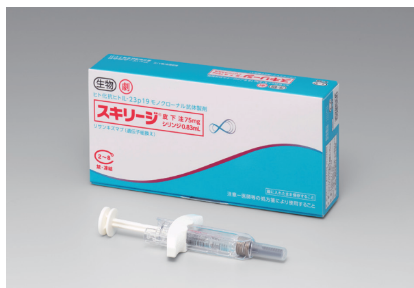
▲ スキリージ 皮下注75mg シリンジ0.83mL