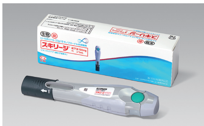
▲ スキリージ 皮下注150mg ペン1mL