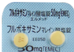
フルボキサミンマレイン酸塩錠 50mg「EMEC」