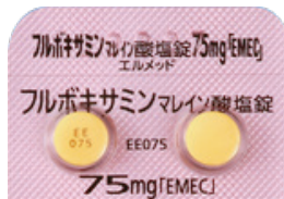
フルボキサミンマレイン酸塩錠 75mg「EMEC」