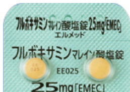
フルボキサミンマレイン酸塩錠 25mg「EMEC」