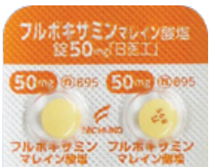
フルボキサミンマレイン酸塩錠 50mg「日医工」