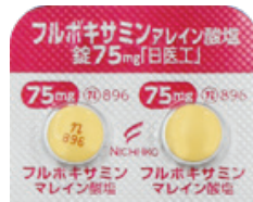
フルボキサミンマレイン酸塩錠 75mg「日医工」