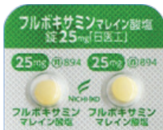
フルボキサミンマレイン酸塩錠 25mg「日医工」