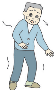
● 低血圧 (めまい、立ちくらみ)