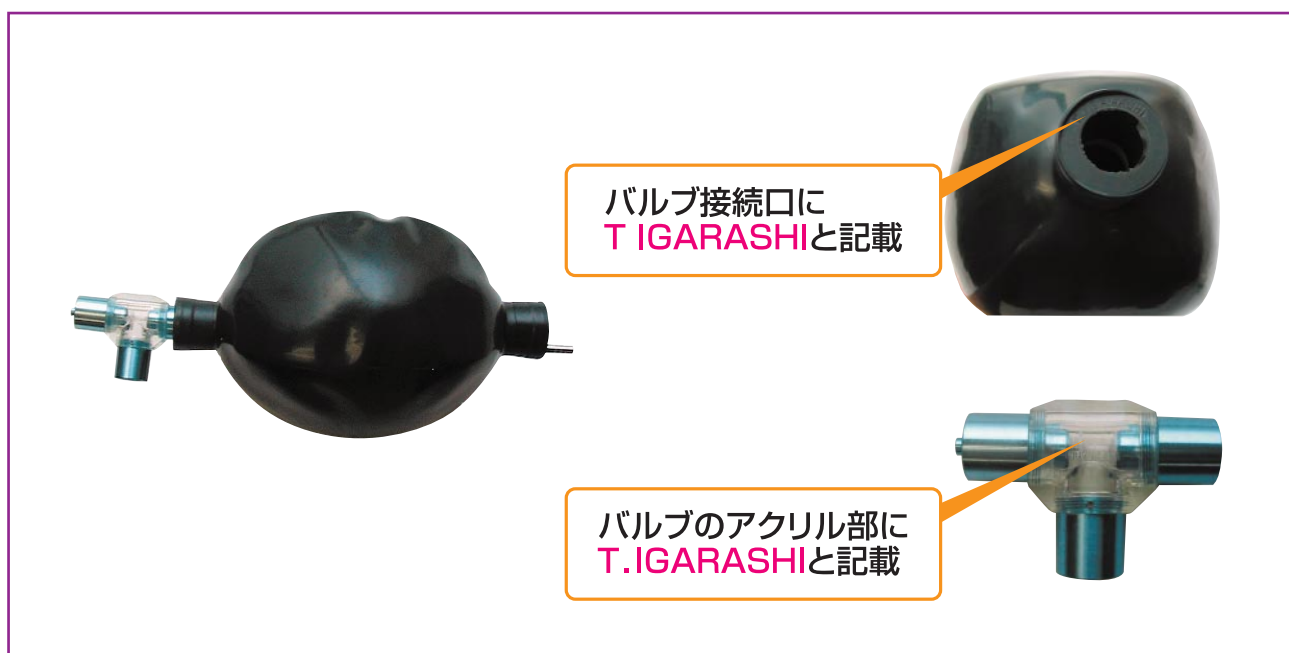
写真2 五十嵐医科工業株式会社 製品

本製品のお問い合わせ先：アイ・エム・アイ株式会社 048-988-4410 , 048-988-4440