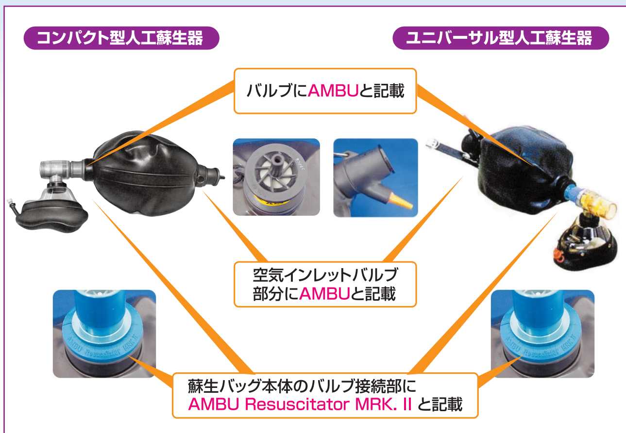
写真1 アイ・エム・アイ株式会社 製品

本製品のお問い合わせ先：アイ・エム・アイ株式会社 048-988-4410 , 048-988-4440