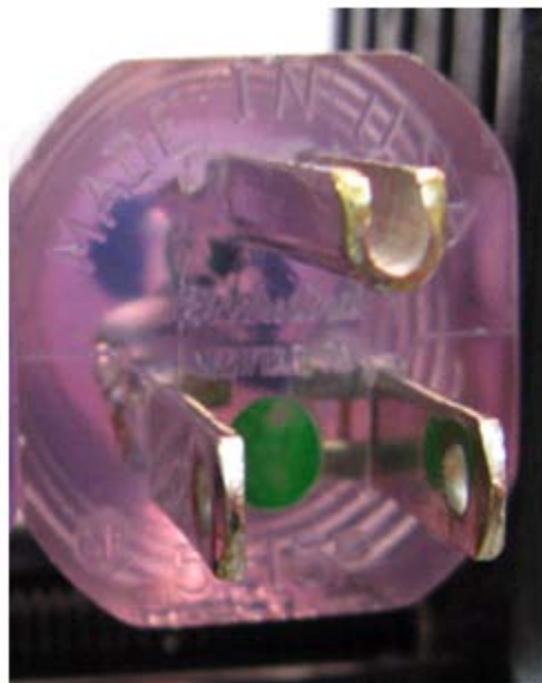
該当しないプラグ