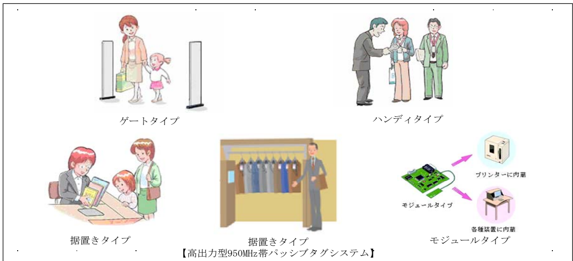
図4 各タイプのRFID機器