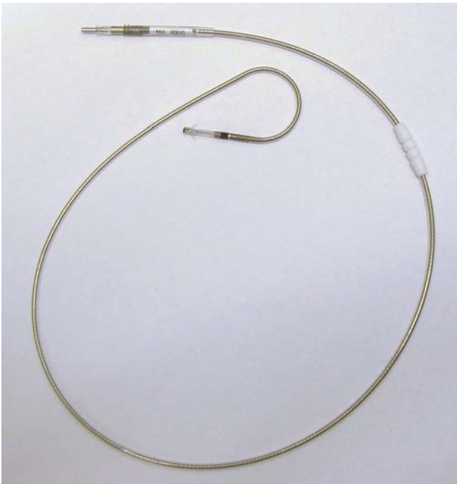
(2)双極タイン型Jカーブ(1944T)